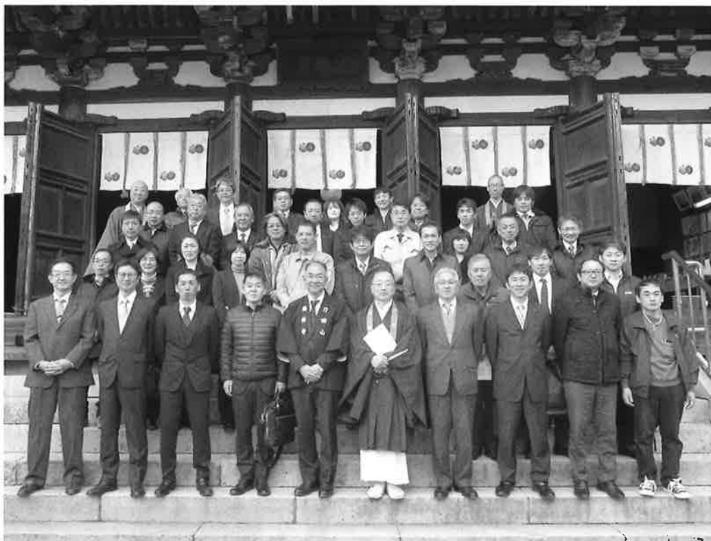
安全祈願(刀田山鶴林寺)記念撮影

編集と発行 加古川労働基準協会 広報部 〒675-0031 加古川市加古川町北在家2006番地永田ビル4階 ☎079-421-0102 FAX079-421-7601 E-mail info@kakogawa-kyoukai.com http://www.kakogawa-kyoukai.com No.611 令和2年3月1日